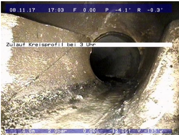
Ausschnitt Kanalaufnahmen innerhalb der Phase 1 des GEP 2. Sissle.