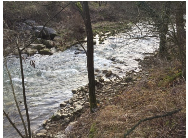
Gewässerbegehung innerhalb der Phase 1 des GEP 2. Sissle.