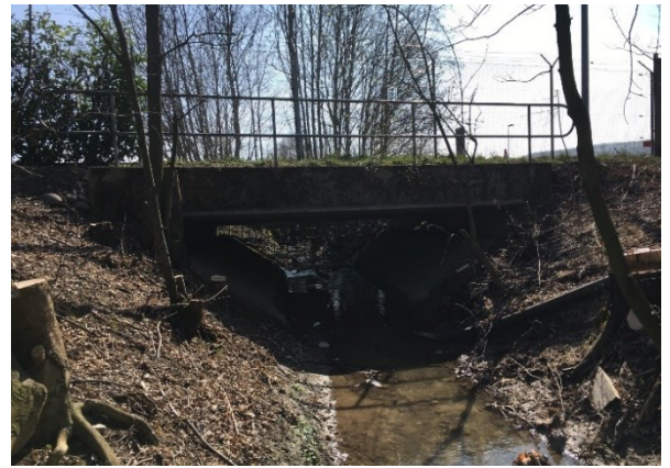
Gewässerbegehung innerhalb der Phase 1 des GEP 2. Stein.