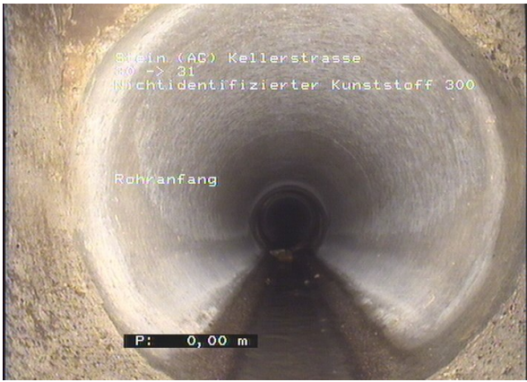
Ausschnitt Kanalaufnahmen innerhalb der Phase 1 des GEP 2. Stein.